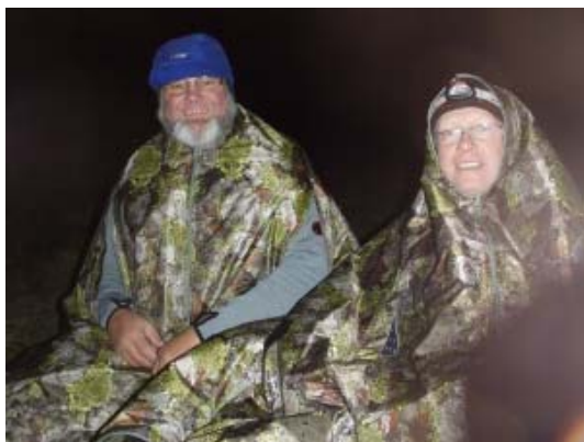
Burka-gjengen ved grillen

Litt senere fikk jeg god treff på ei bølge, og det var som å bli skutt ut av en kanon, halve kajakken var ute av vannet, og det fosset rundt sidene. Plutselig lå jeg helt over på venstre side, og tenke at: nå velter jeg.., nå velter jeg - men heldigvis fikk jeg satt et godt støttetak, og med en hoftevrikk var jeg opp igjen - skal si adrenalinet flommet fritt i årene et par sekunder. En våkner av slikt. Fikk til flere gode surfer på turen videre innover, men var litt mer forsiktig så det var aldri fare for å velte.